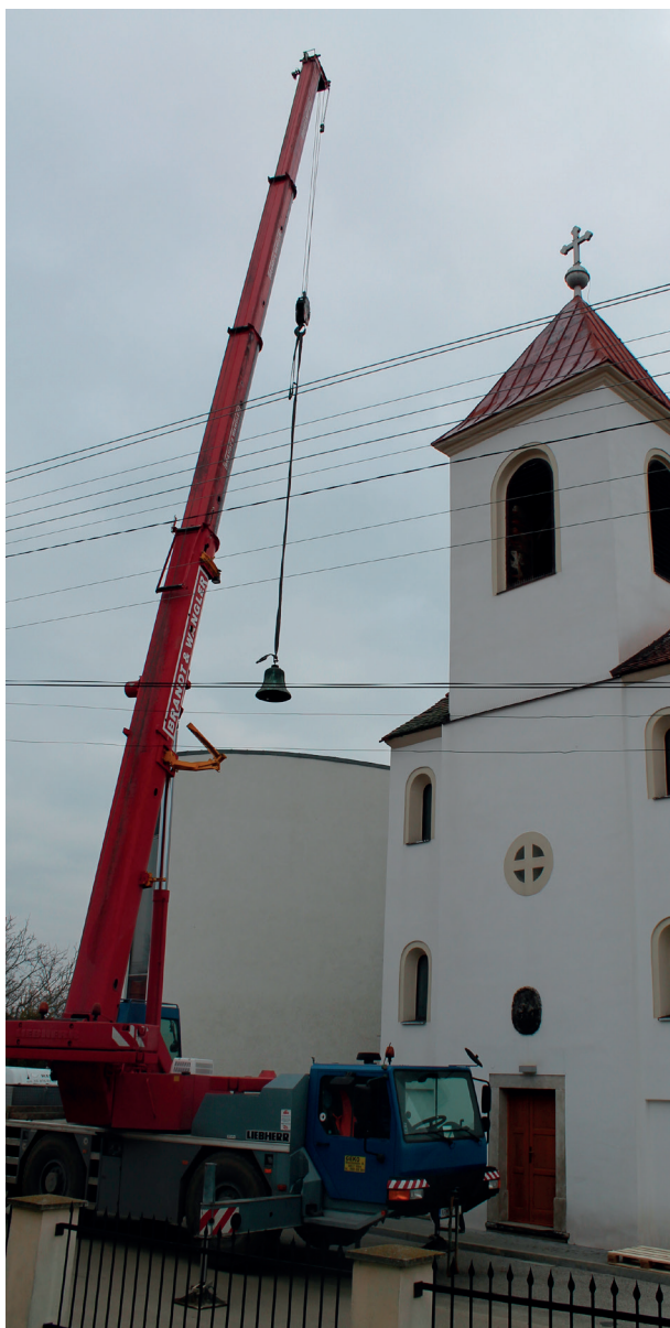
Zvon z roku 1925 s Máriiným reliéfom a jeho „posledná cesta“ dole z veže.