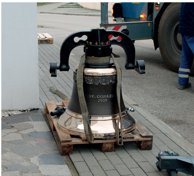
260 kilogramový sv. Gorazd